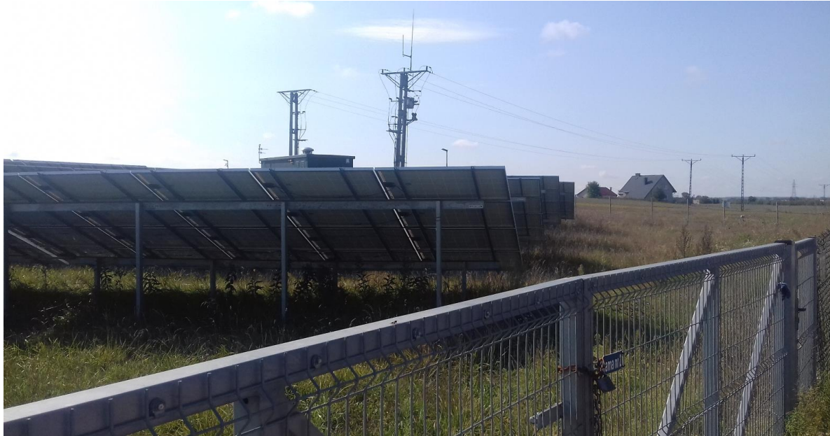
Zdjęcie. Przykładowe ogrodzenie wraz z systemem alarmowo – monitoringowym na farmie PV pod Lublinem (M. Szlaps)