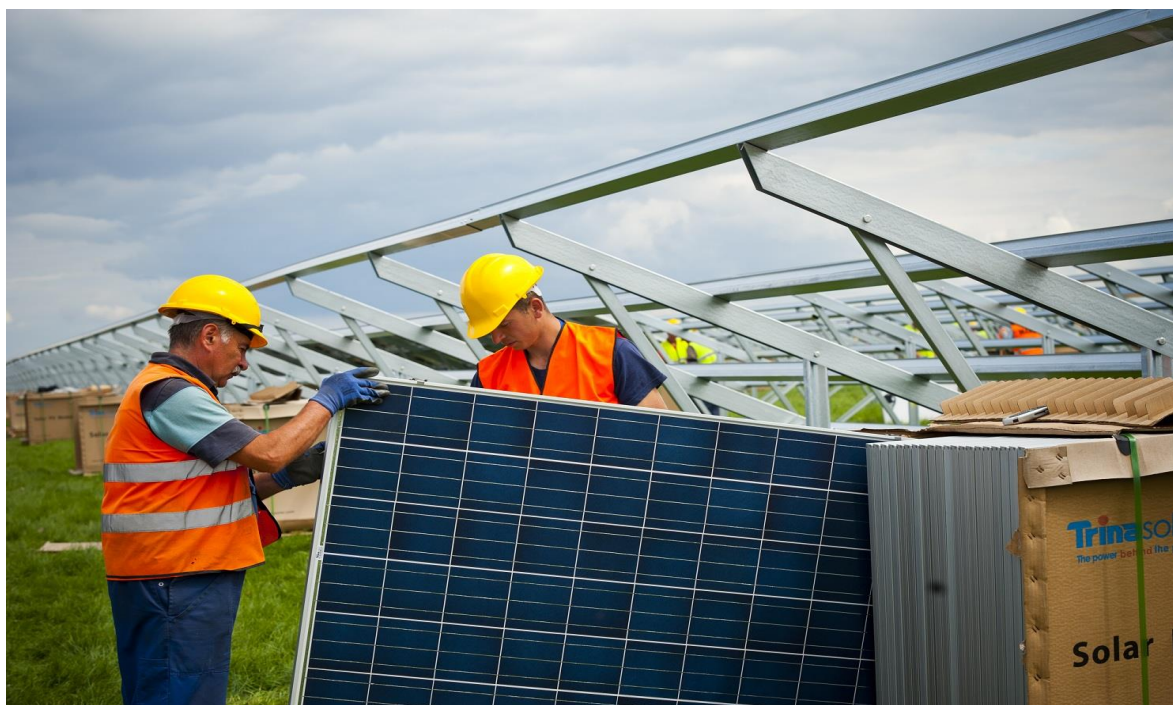
Zdjęcia. Budowa farmy solarnej Bautzen (Niemcy) 310MW na powierzchni ok. 70ha przez polską firmę Remor Solar z Recza

Ogniwa fotowoltaiczne pracują bezobsługowo. Montaż odbywa się w miejscu posadowienia z gotowych elementów bezpośrednio na gruncie. Montaż obejmuje wbicie (bądź wkręcenie) do gruntu konstrukcji mocujących w formie metalowych słupków, do których przykręcane są panele fotowoltaiczne, podłączane są przetwornice, inwertery i inne urządzenia wspomagające pracę ogniw. Panele fotowoltaiczne oddają ciepło przez konwekcję naturalną do przepływającego powietrza atmosferycznego. Jest to jedyny i w pełni wystarczający system chłodzenia. Nie przewiduje się montażu wentylatorów. Inwertery chłodzone są w ten sam sposób. Planuje się minimum 29-letni okres eksploatacji instalacji.